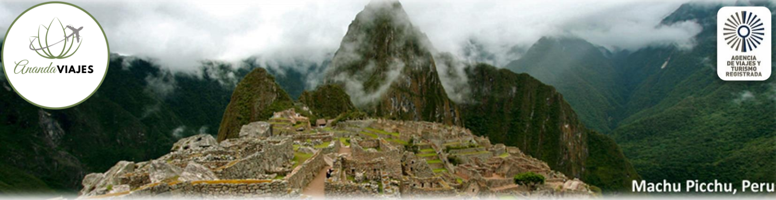
Machu Picchu, Peru