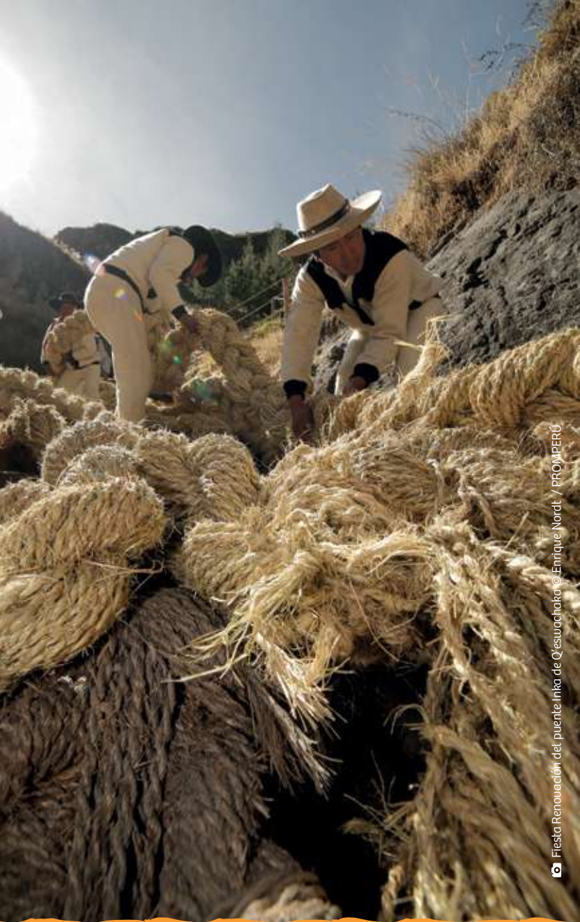
Fiesta Renovación del puente Inka de Q'eswachaka