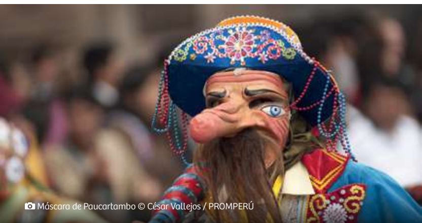
📷 Máscara de Paucartambo

Hay que descubrir también las chicherías y picanterías que aún quedan, son pocas y en ellas se comparte la mesa, se sirve malaya frita, zarza de patitas, sara lawa (crema de maíz), adobo, soltero de queso, trucha frita y chicharrón con mote. Infaltable, chicha de maíz para acompañar y alegrar.