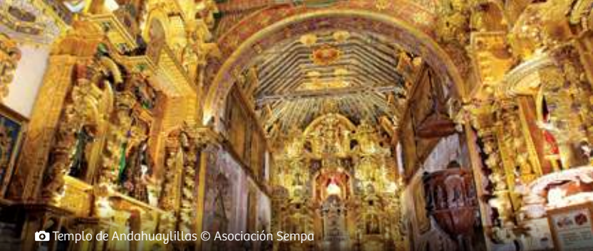
📷 Templo de Andahuaylillas