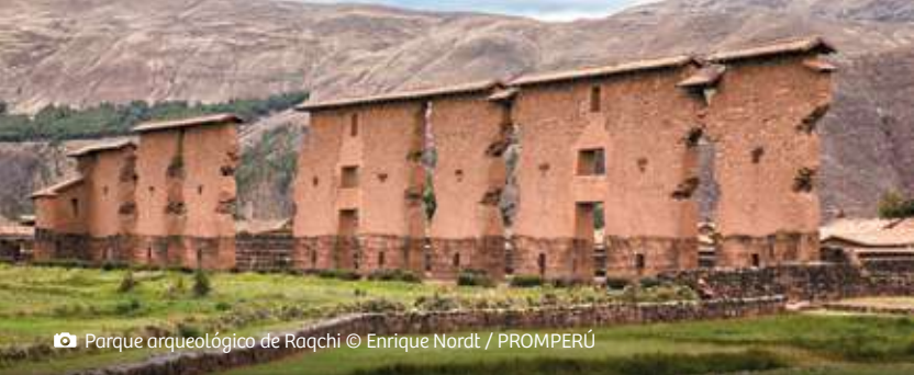
📷 Parque arqueológico de Raqchi