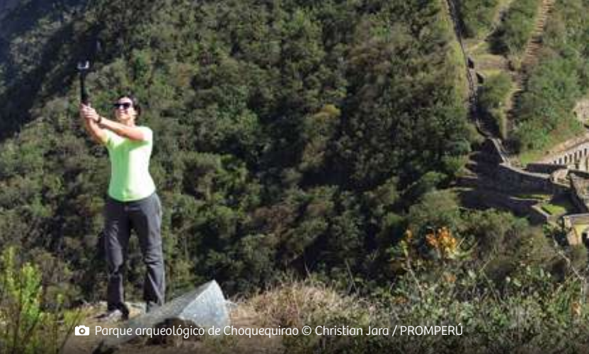
📷 Parque arqueológico de Choquequirao