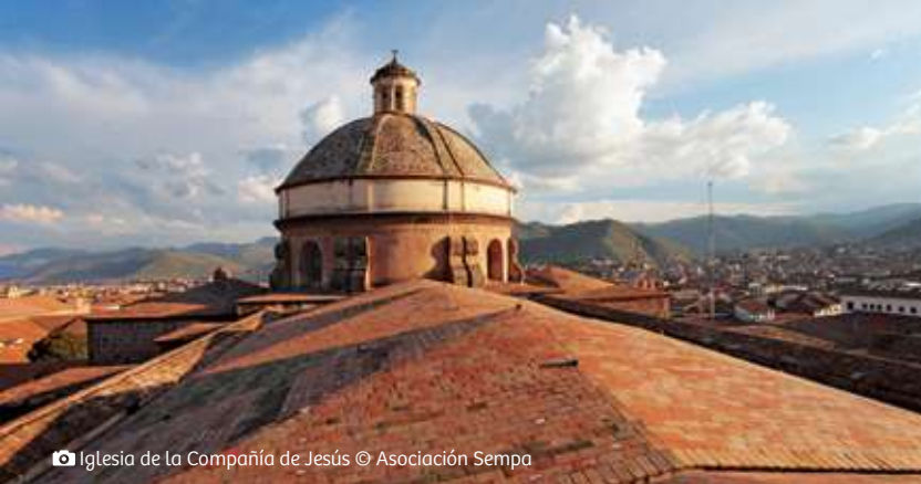
📹 Iglesia de la Compañía de Jesús